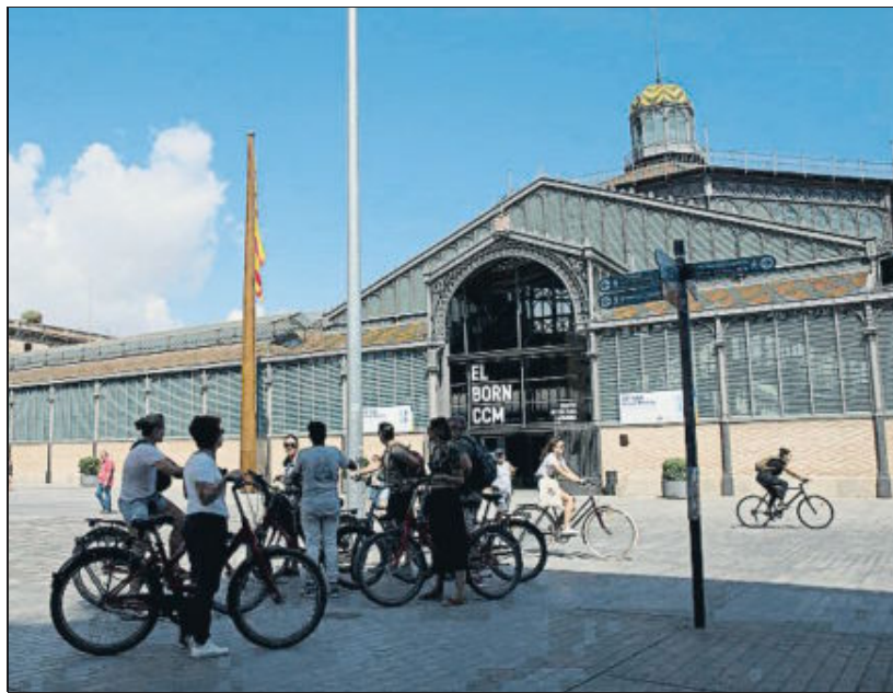
La monumental senyera, amb un pal de 17,14 metres d'alçària, que presideix l'entrada del Born

El març passat es va presentar el pla director –amb l'horitzó de l'any 2025– i actualment s'estan treballant les propostes i mesures que donaran cos a la programació del Born els pròxims tres anys... si és que un nou canvi polític a