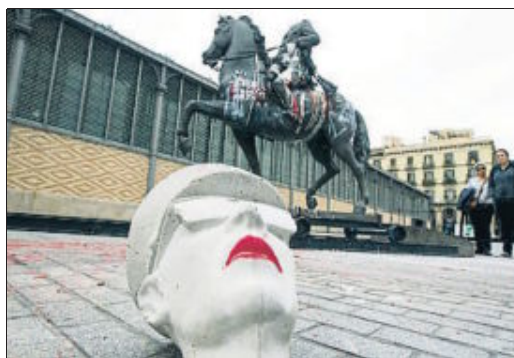
Un cap fals de Franco al costat de l'estàtua decapitada

■ L'exhumació –descansava en un magatzem, on va perdre el cap– de l'estàtua equestre de Franco obra de Josep Viladomat va provocar l'octubre del 2016 la polèmica més mediàtica del Born. Es tractava de reflexionar sobre "la impunitat del franquisme" i "la banalització de l'espai públic", però l'abatiment i lapidació (amb ous i pintura en lloc de pedres) de l'efigie del dictador va fer que la reflexió durés només tres dies, el temps que va trigar a ser retirat. Per l'exposició de pagament que incloïa aquesta escultura hi van passar 12.252 persones, una mitjana d'unes 150 al dia.