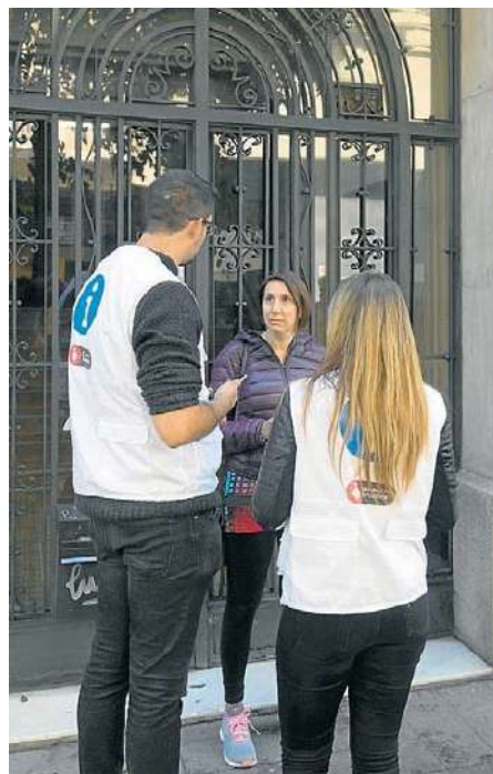
Dos visualitzadors ahir a Barcelona a la recerca de possibles pisos turístics il·legals. MANOLO GARCIA

Com a novetat en la lluita contra els pisos turístics il·legals, aquest any els integrants del cos de visualitzadors disposaran d'un nou local al recinte de l'Estació del Nord. Seran 80 metres quadrats en total amb 15