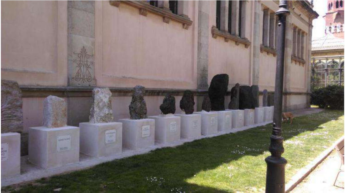
Minerals exposats davant del Museu Martorell

Passejar per aquest recinte provoca tristor a algunes de les persones que, durant dècades, s'han deixat la pell per garantir la seva conservació. Vidres trencats a l'hivernacle, fustes deteriorades a l'umbracle, façana amb desprendiments al Castell dels Tres Dragons. La mala senyalització dels espais i la poca inversió del consistori per explicar el seu valor i les seves potencialitats a la ciutadania salten a la vista. No només parlem d'uns edificis i les seves col·leccions, tot el parc està pensat per ser una gran exposició de la natura. El parc de la Ciutadella esdevé, doncs, un dels tres pilars del coneixement del món de la natura que tenim a Barcelona, juntament amb l'edifici Blau del recinte del Fòrum, on hi ha l'exposició permanent –molt visitada per escoles– i el Jardí Botànic i l'Institut Botànic de la muntanya de Montjuïc.