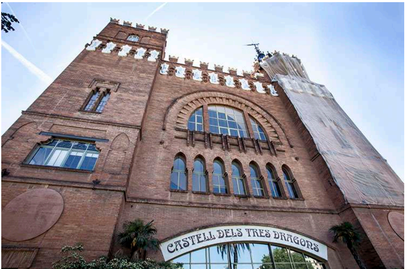
Façana principal del Castell dels Tres Dragons