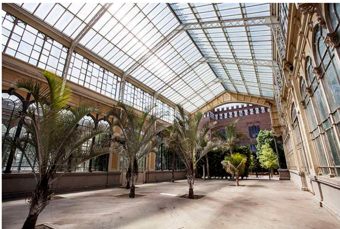
Darrerament, s'han trencat alguns vidres de l'hivernacle i no s'han restaurat

La revolució de 1868, especialment forta al camp andalús, va forçar l'exili de la reina Isabel II a París i, de retruc, va debilitar la presència militar espanyola a Barcelona. L'Ajuntament de Barcelona va aprofitar el context històric per canviar la titularitat dels terrenys de la ciutadella militar, que van passar a ser municipals. Aquell mateix any, va començar l'enderroc del fortí que s'havia construït l'any 1716 sobre les runes d'un miler d'habitatges de la població més humil i treballadora del barri de la Ribera. Durant un segle i mig, des de la Ciutadella i des de Montjuïc, els enginyers militars borbònics van esclafar tota revolta que floria dins la ciutat. La Ciutadella significava la guerra, la mort, l'opressió. És per això que aixecar un parc de la ciència sobre les restes d'un complex militar és, per les institucions impulsores del cicle de conferències de l'any passat, “un dels principals actes d'afirmació col·lectiva de Barcelona”. L'objectiu del nou parc de la Ciutadella, amb l'excusa de l'Exposició Universal de 1888, era la promoció de la pau, la ciència, el coneixement i la tecnologia. Tot el que trobem al parc va ser pensat de manera integral amb aquesta finalitat.