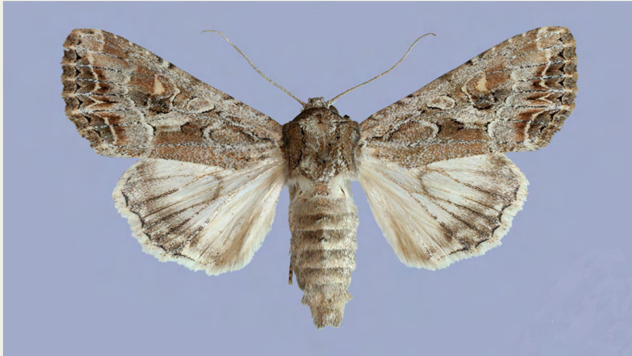
Mamestra blenna ( Hübner, 1824 )

Element mediterrani asiàtic que habita indrets litorals de caire halòfil. Esmentat dels aiguamolls del Roselló francès, a la península Ibèrica nomès ha estat trobat als aiguamolls de l'Emporda (on es troba ben assentada) i al delta del Llobregat. Vola en dues generacions, els mesos de maig-juny i agost-setembre.