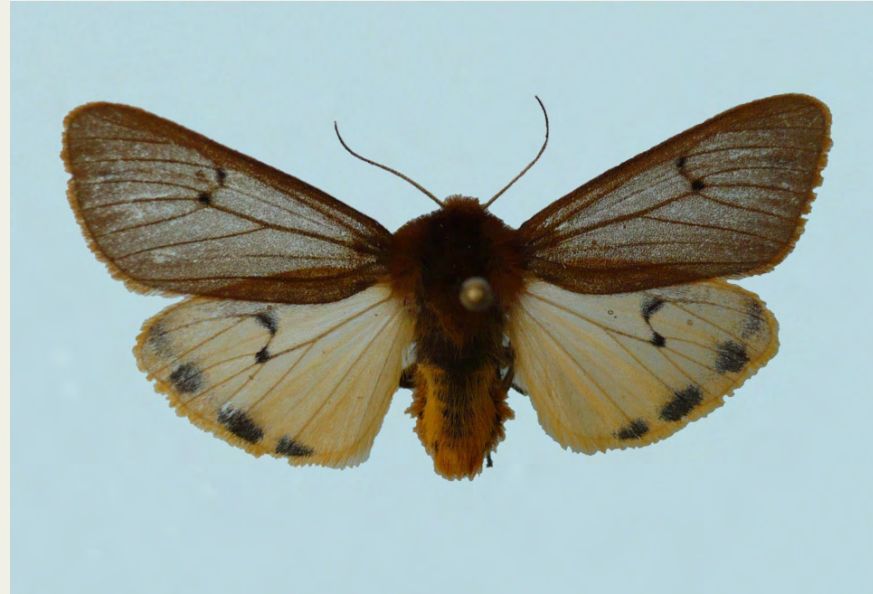
Phragmatobia fuliginosa f. flavida Oberthür, 1901

Forma albina descrita dels Prineus Centrals francesos (Lourdes) i no esmentada fins ara de la fauna ibèrica.