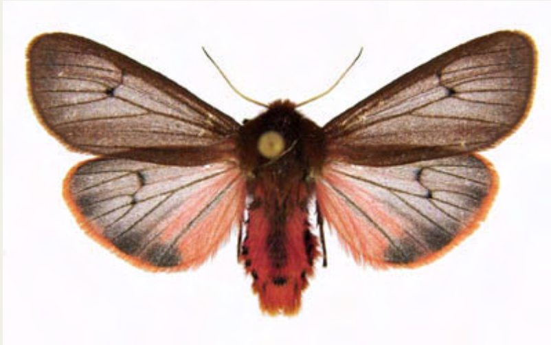
Phragmatobia fuliginosa ( Linnaeus, 1758 )