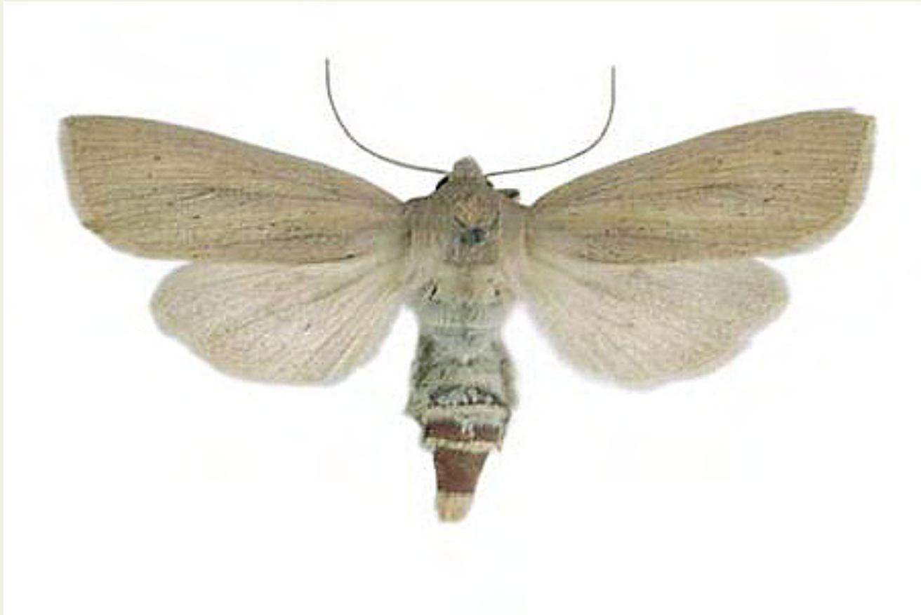
Rhizedra lutosa (Hübner, 1803)

És un típic tàxon palustre que viu als indrets humits (aiguamolls, estanys, basses, rius i rierols) on creixen els canyisos ( Phragmites sp. ) Vola els mesos de setembre i octubre.