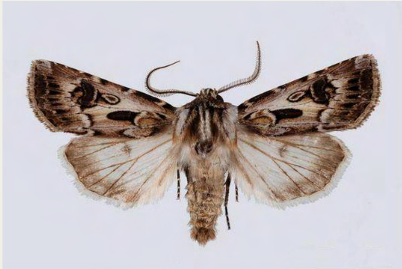
Agrotis vestigialis (Hufnagel 1766)

Tàxon eurosiberià halòfil, conegut a Catalunya dels aiguamolls de l'Empordà i del delta del Llobregat. Habita també els aiguamolls del Roselló francès. L'adult vola des de finals de setembre fins a mitjans d'octubre.