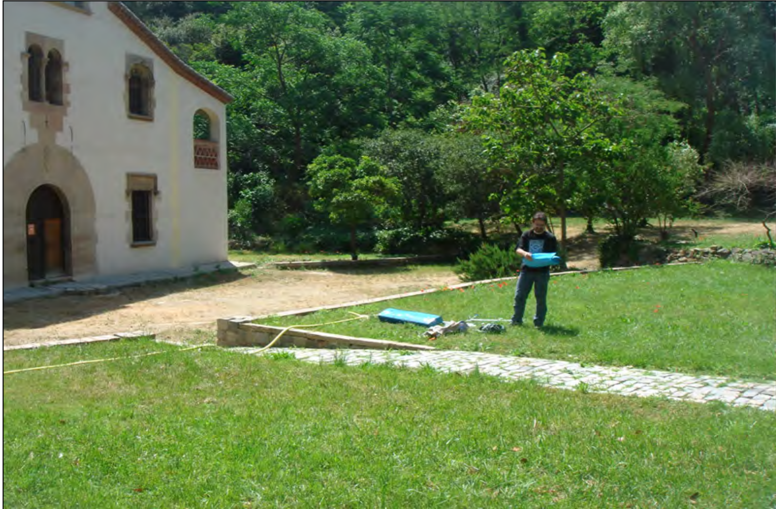
VI Trobada Francesc Español 26 novembre 2011