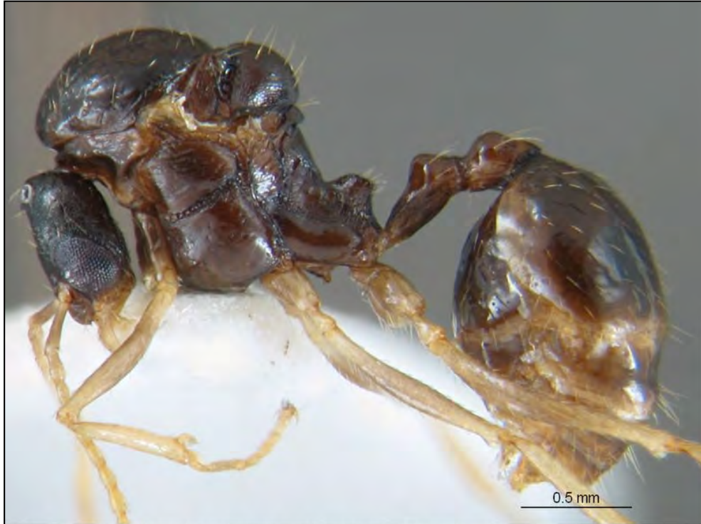
KG1236 Randa, Mallorca (España). 39° 31' N, 2° 55' E. 320 m. leg: K. Gómez, 19/07/2004 Encinar.