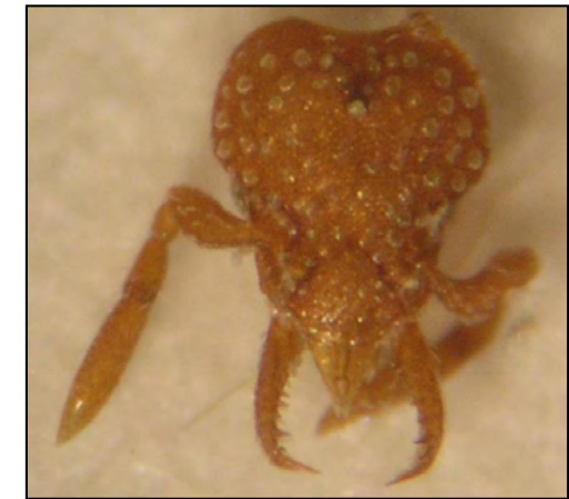
P. argiola (Emery, 1869), mascle i reina