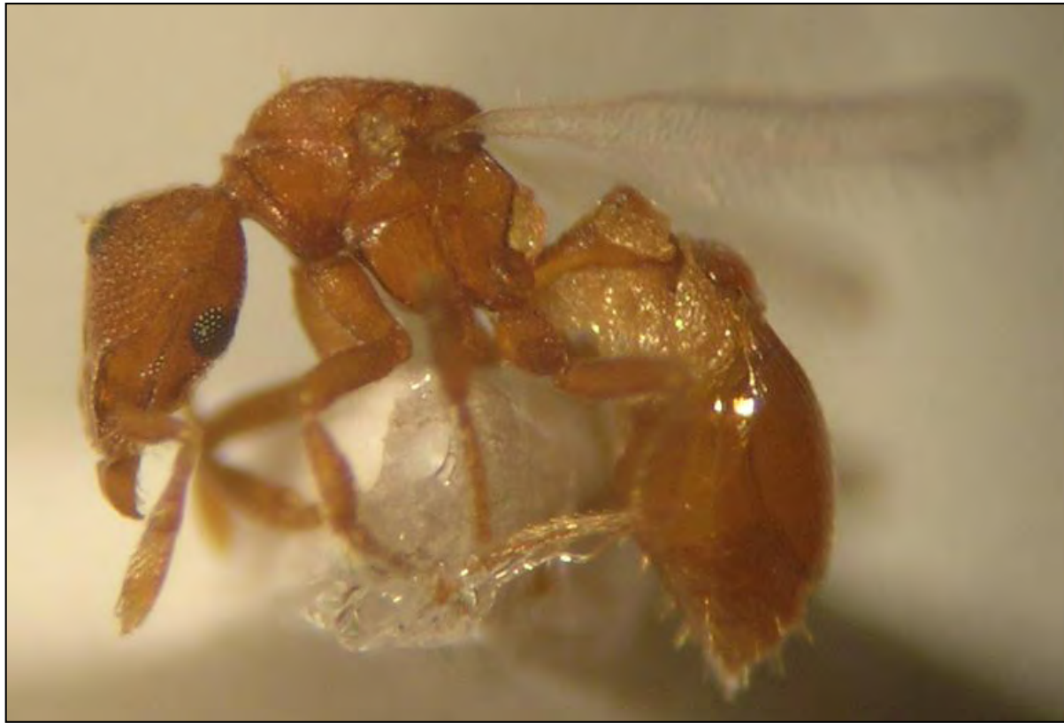
P. membranifera (Emery, 1869), reina