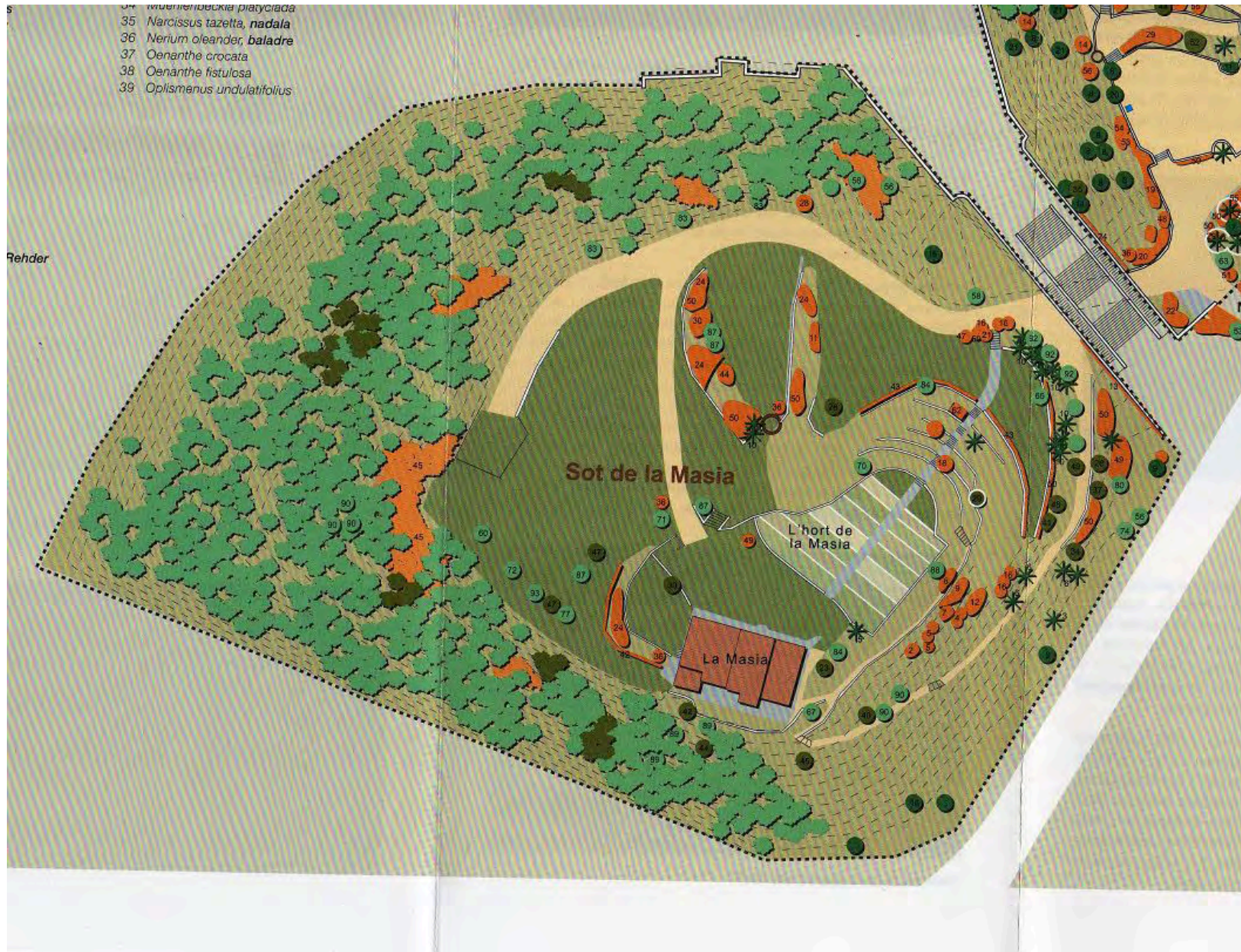
VI Trobada Francesc Español 26 novembre 2011