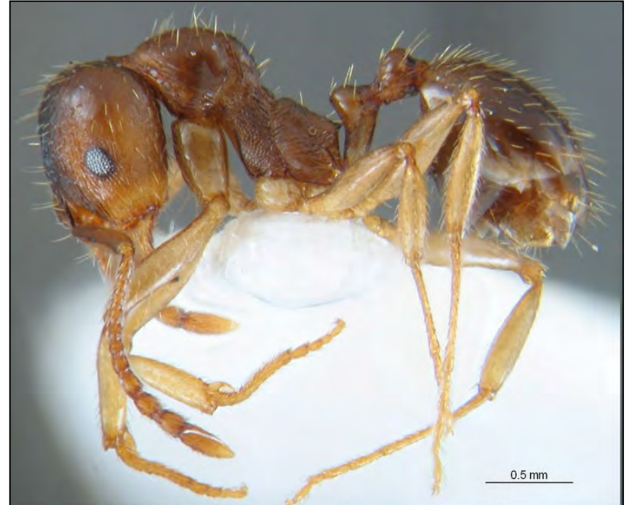
KG1234 Randa, Mallorca (España). 39° 31' N, 2° 55' E. 320 m. leg: K. Gómez, 19/07/2004 Encinar.

Aphaenogaster subterranea (Latreille, 1798), mascle i obrera