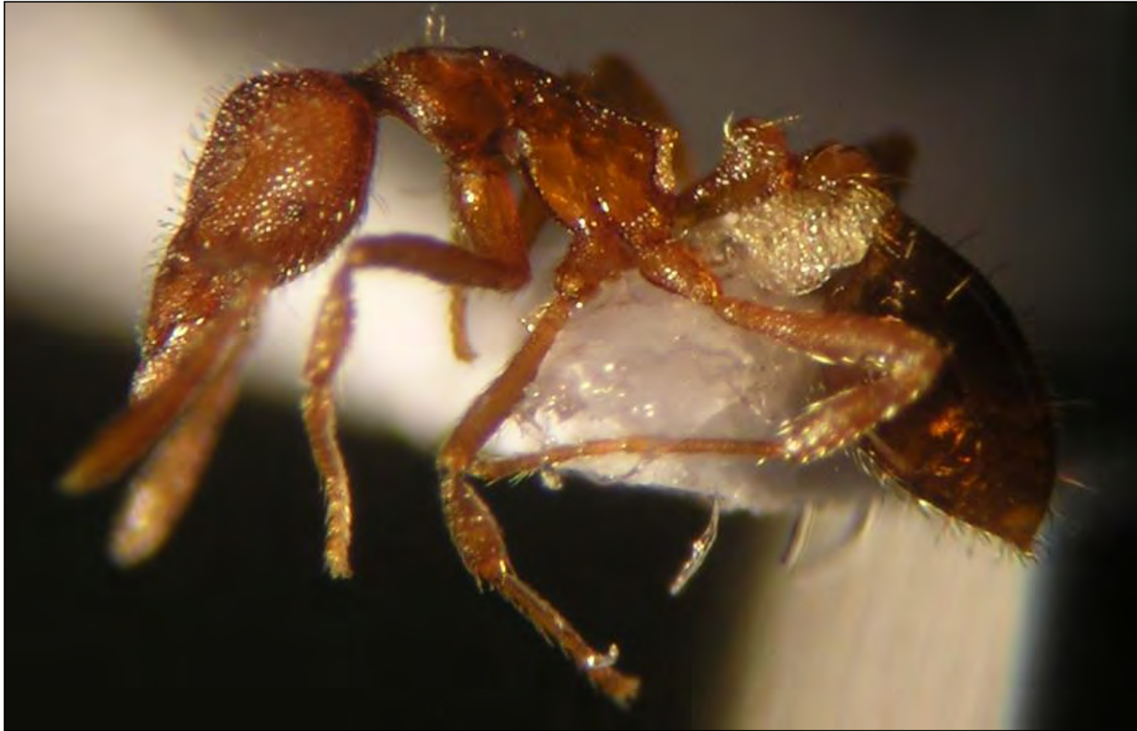
Pyramica tenuipilis (Emery, 1915) , obrera