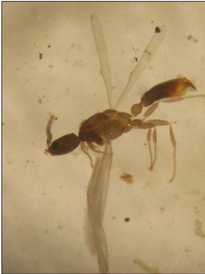
Leptanilla sp, mascle