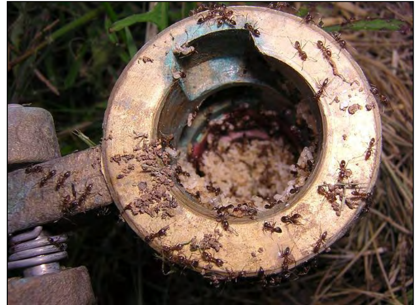
L. humile al Jardí Botànic de Barcelona