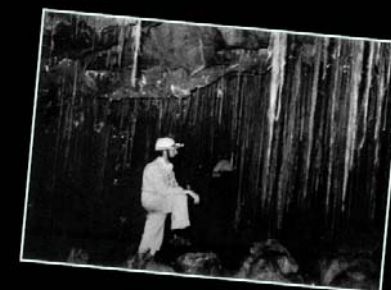
1977. Expedició Rwanda. En la Uwuvumo bwa Musanze, cova volcànica amb 31 boques i envaïda per una densa vegetació equatorial.

Documentació proporcionada per Montserrat Montoriol i Enric Gassol